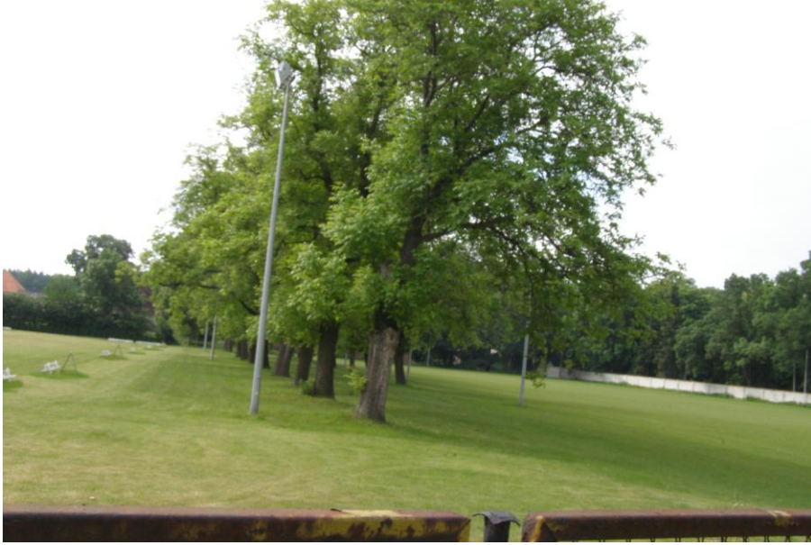
Parkur – miejsce rozgrywania zawodów konnych.