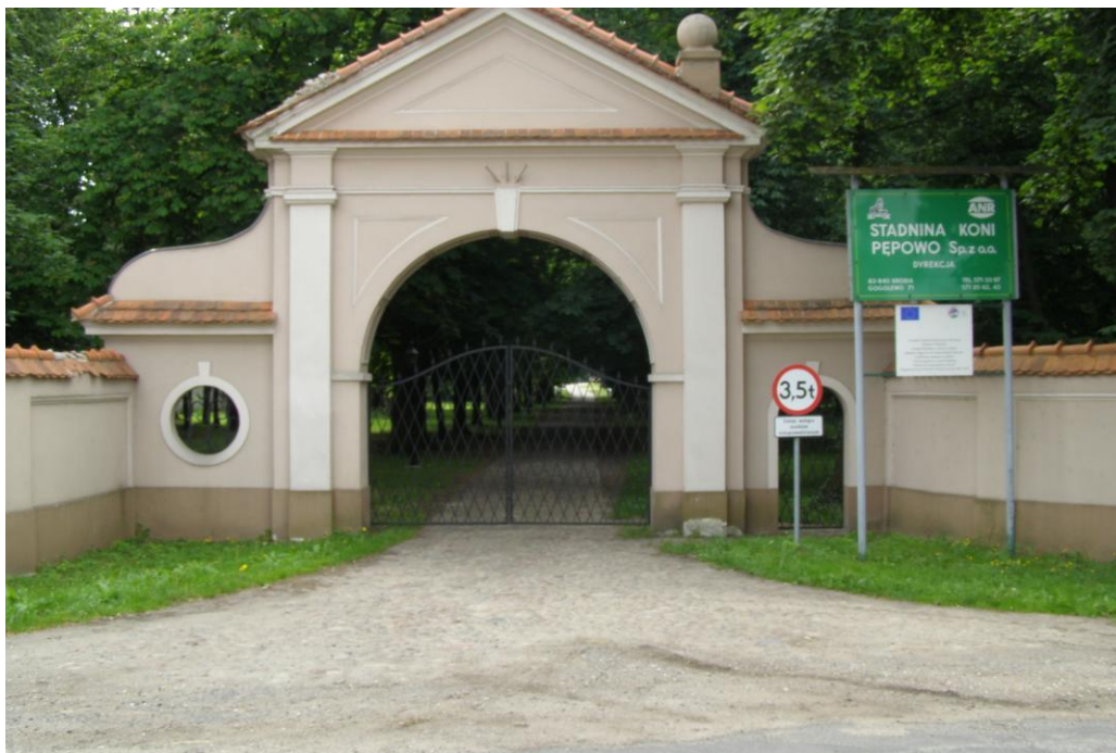
Brama do zespołu parkowo pałacowego.