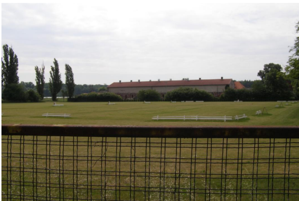
Parkur – miejsce rozgrywania zawodów konnych.